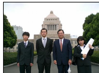
インターン生と国会へ