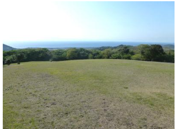
富士山や相模湾を見渡す広大な芝生の土地

その後、広大な土地を活かしたリスの見学施設を作り、好評を博してきましたが、その運営方針が徐々に変わってきている様子でした。現在では、地域の特徴に合わせた椿を始めとする花類のための施設に転換を図っておられていました。個人で取り組まれるそのバイタリティーに敬服するものでした。成功を願っております。その一角に、広い芝生の高台から伊豆半島・富士山を見渡せる場所が開かれており、何も置かない空間が創られていました。島の宿泊施設で個人客の人気を博するものが定着すれば、定常的に観光客の増加につながるのではないのでしょうか。