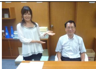
インターン生募集中