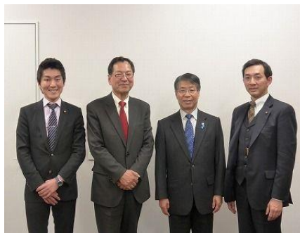
(写真は私が所属する「保守連合」4名の議員)

都知事選挙後で、しかも悪天候もあって前回と比べ 10%ほど下がった得票率、自民党候補の得票状況を見ると、吉田つとむの連続トップと言う結果は「良識ある開かれた無所属保守」を訴え、「無党派」の中で固定的な支持層が形成されてきている流れを表すもの