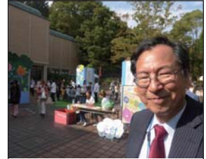
双方向の情報交流