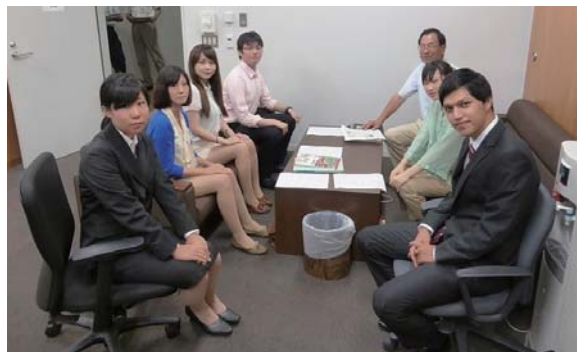
定例会中、来訪者と研修生と一緒に記念写真

採決の翌日の読売新聞報道では、「決議は自民党と、無所属議員らで構成する保守連合の2会派が共同提出した」としています。誰が提案し、同調者が誰かを直接対象の議員にヒアリングでの取材をせずに事務局に資料をもらって記事を書く癖がこのような書き方になったのでしょうか。朝日の轍を踏まないように願っています。