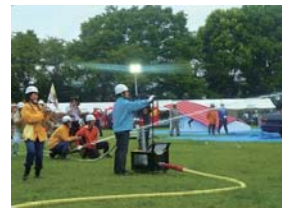
町田市総合防災訓練時の自主防災隊の雄姿