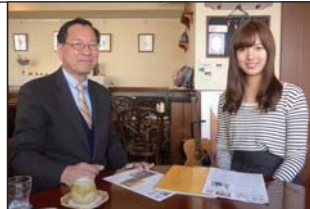
次期インターン生を募集しています